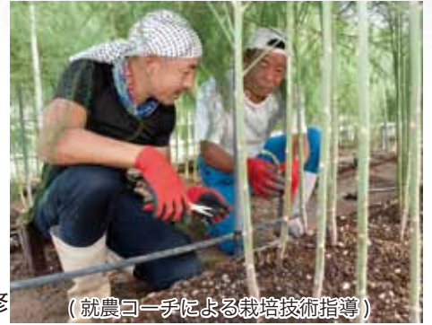
(就農コーチによる栽培技術指導)

佐伯市では推進品目として、上記農産物の栽培・経営技術を就農コーチ(ベテラン農家)のもとで研修するファーマーズスクールを設置・運営しており、2年間での新規就農者の育成を図っています。