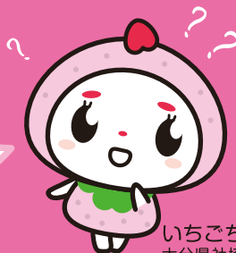
いちごちゃん 大分県社協マスコットキャラクター