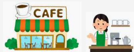
地域課題解決型起業