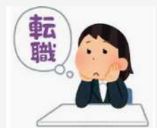
県マッチングサイト企業に就職