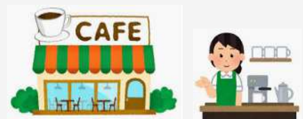
地域課題解決型起業